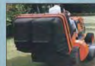
SBĚRNÝ KOŠ NA TRÁVU S MOŽNOSTÍ VYPRAZDŇOVÁNÍ NA ZEMI