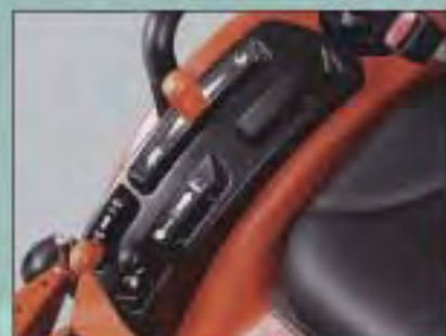
KOMFORTNÍ OVLÁDACÍ PRVKY

S ohledem na vyšší jízdní komfort došlo u našeho nového BX2350 ke změně uložení pedálů. Pedály pro jízdu vpřed a vzad jsou oddělené a ovládač pro zapnutí náhonu na všechna kola je umístěn po straně sedadla řidiče. Řidič má tak více prostoru. Místo řidiče je o 101,6 mm širší a o 50,8 mm delší než u předchozích modelů řady BX a poskytuje tak výrazně více prostoru pro nohy.