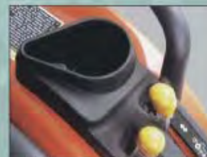
DRŽÁK POHÁRKU NA NÁPOJE