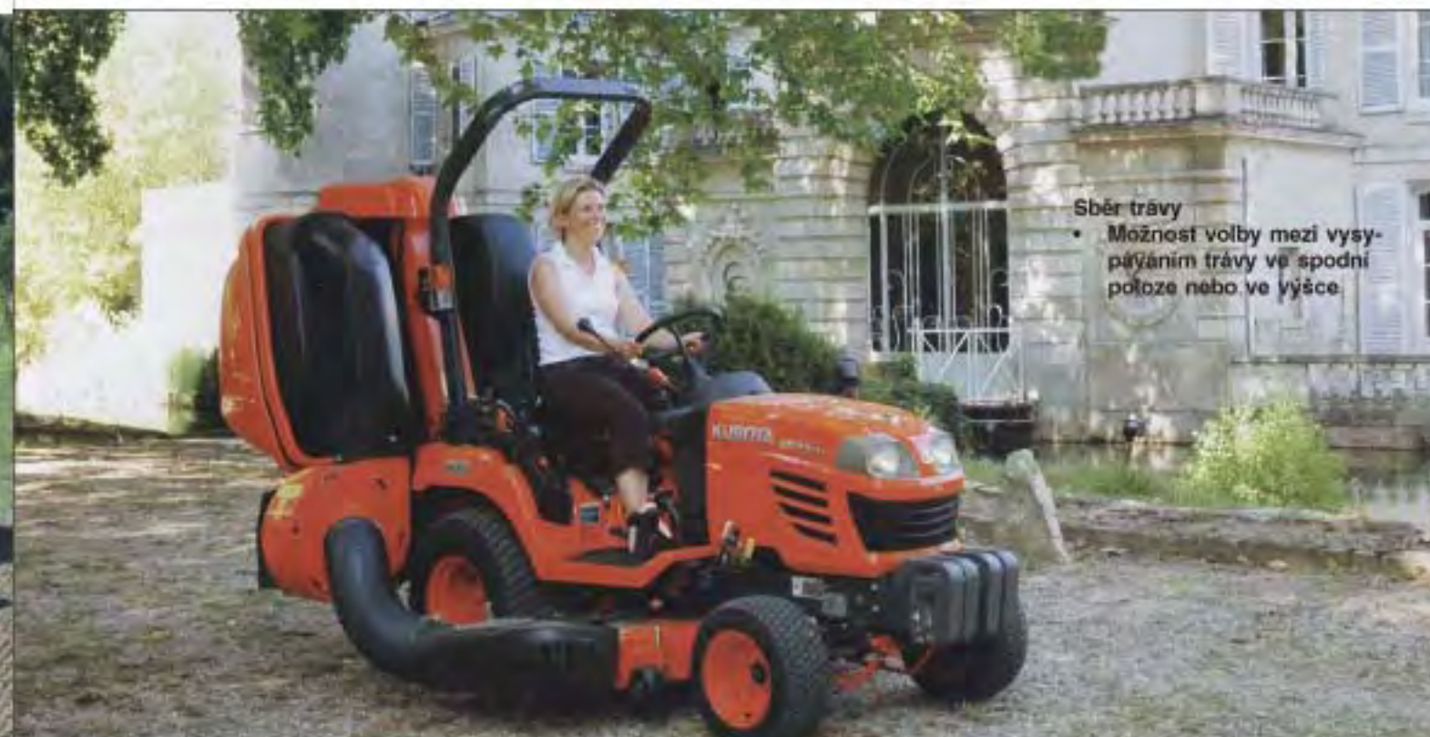
Sběr trávy • Možnost volby mezi vysypáním trávy ve spodní poloze nebo ve výšce