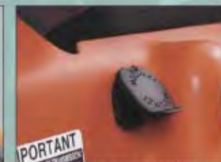
ZÁSUVKA NA STEJNOSMĚRNÝ PROUD