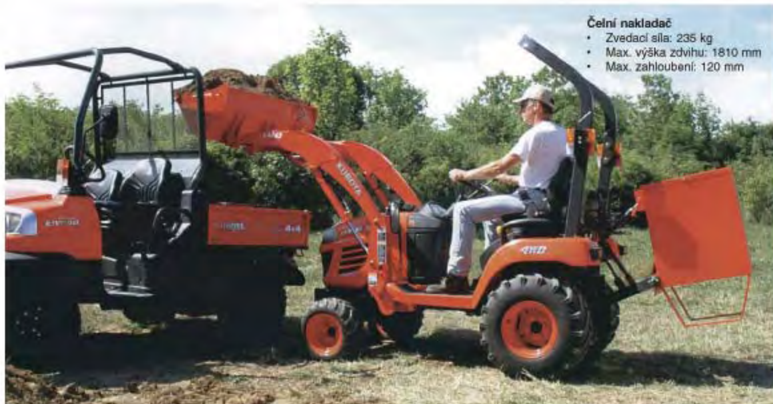
Čelní nakladač • Zvedací síla: 235 kg • Max. výška zdvihu: 1810 mm • Max. zahloubení: 120 mm