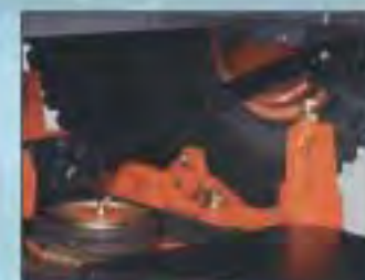
ROBUSTNÍ POHON KLOUBOVÉ HŘÍDELE