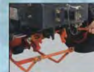
SYSTÉM RYCHLÉ MONTÁŽE