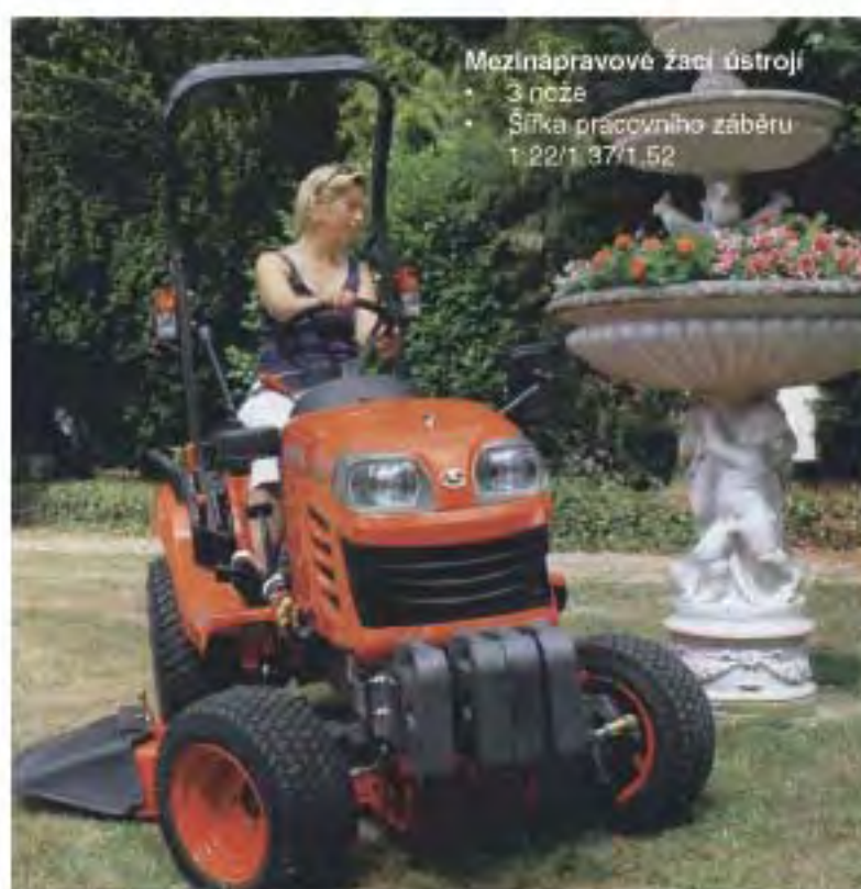
Mezinápravové záci ústrojí • 3 pozice • Šířka pracovního záběru: 1 221 / 3 711 / 5 2