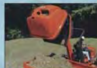
SBĚRNÝ KOŠ NA TRÁVU S MOŽNOSTÍ VYPRAZDŇOVÁNÍ VE ZVEDNUTÉ POLOZE