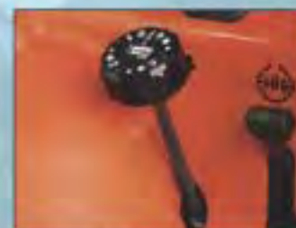
CENTRÁLNÍ PŘESTAVOVÁNÍ VÝŠKY SEČENÍ