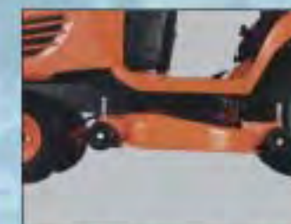
VELKÁ SVĚTLÁ VÝŠKA